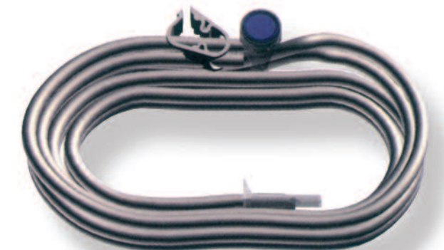
▶ Standardschlauch mit Absaugung 5740-020S